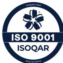
Cert No. XXXX

下図のISO 9001、ISO 14001、ISO 45001、ISO/IEC 27001のように、複数の規格固有のISOQARロゴを使用する場合も同様です。