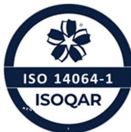
Verification Number XXXX

The same rules apply when referring to verification only, or to both validation and verification, using the appropriate activity name as described above.