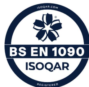
Cert No. XXXX